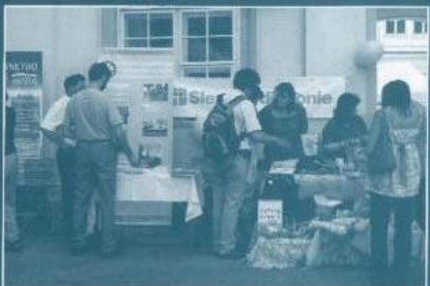
z 1. evanjelických cirkevných dní 27. – 29. 6. 2008 v Bratislave